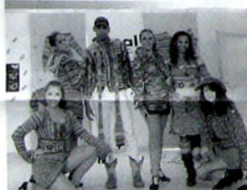
Tuttos Sockenwolle-Tänzer begeisterten

Daß weniger Besucher gekommen waren, könnte unter anderem auch an widrigen Verkehrsverhältnissen gelegen haben: Am Samstag gab es mal wieder Staus im Elbtunnel, und an beiden Messetagen war die A 23 Richtung Norden teilweise gesperrt. Der allzu ruhige Samstag-Vormittag ließ denn auch für die Messe gähnend leere Gänge befürchten, was sich im Verlaufe des Tages und besonders des Sonntags zum Glück nicht bewahrheitete.